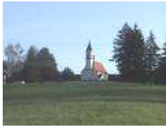
St. Johannes u. Paulus Siggenhofen