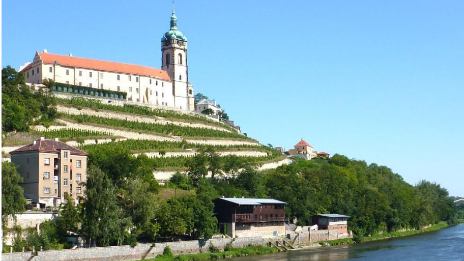
Blick auf Schloss Mělník