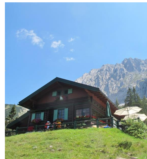
Wanderung zur Hochlandhütte im Karwendel 11.August

Die Naturfreunde werden gefördert von der