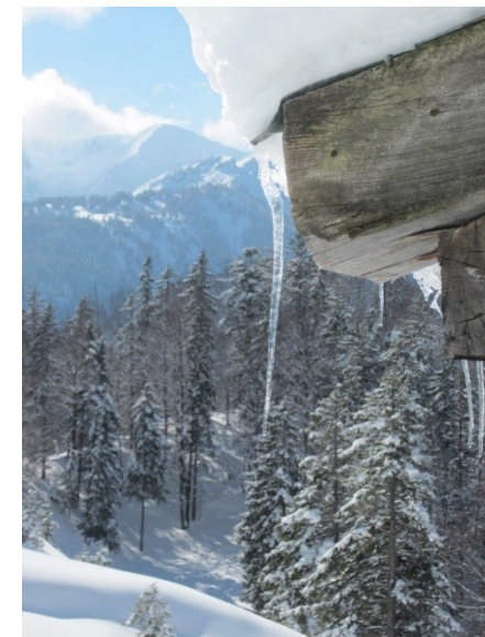
Winter in den bayerischen Alpen

Die Naturfreunde werden gefördert von der