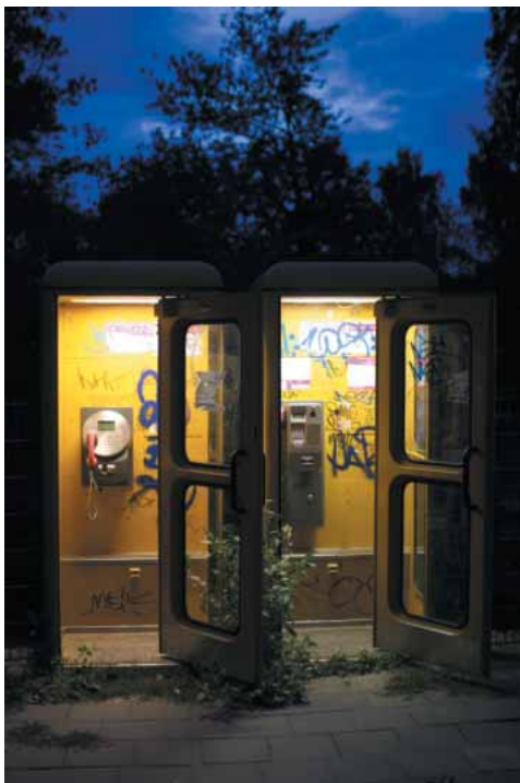
Auch in den guten alten Telefonzellen kann man telefonieren, und das ohne Funkstrahlung.