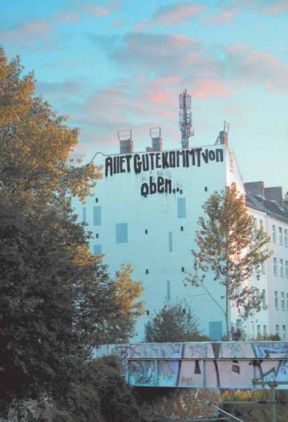
Leider kommt nicht nur Gutes von oben: Mobilfunkanlage auf einem Wohnhaus