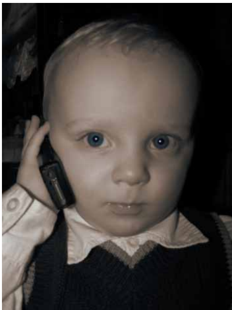
Sieht lustig aus, ist es aber nicht. Kinder sollten nicht mobil oder schnurlos telefonieren.

alle technischen Möglichkeiten auszunutzen, um eine möglichst geringe Exposition von Anwohnern zu gewährleisten. Die Beurteilung von biologischen Wirkungen im Niedrigdosisbereich, ausgehend von Mobilfunkseideanlagen, ist zum gegenwärtigen Zeitpunkt schwierig, jedoch zum vorbeugenden Schutz der öffentlichen Gesundheit unbedingt erforderlich.“