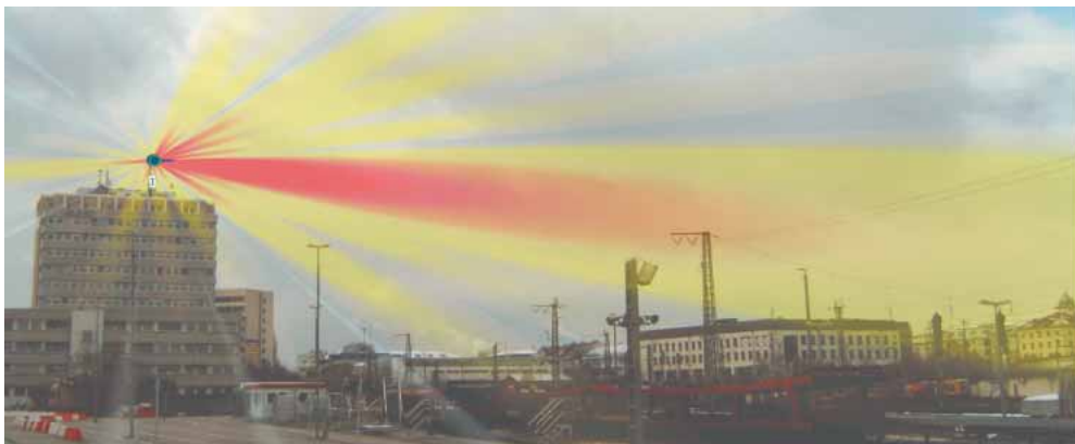
Computersimulation des Feldes einer Mobilfunkantenne. Rot: oberhalb, gelb und keine Einfärbung: unterhalb des Salzburger Resolutionswerts (siehe Seite 13). Ist die Funkantenne auf einem Hochhaus, werden niedrige Nachbarhäuser vom Hauptstrahl verschont.

wir mit lediglich einem flächendeckenden Netz hätten. Über Online-Datenbanken können Sie sehen, wo die in Betrieb befindlichen Masten stehen. Links zu diesen Datenbanken finden Sie unter der Internetadresse: www.umweltinstitut.org/elektrosmog