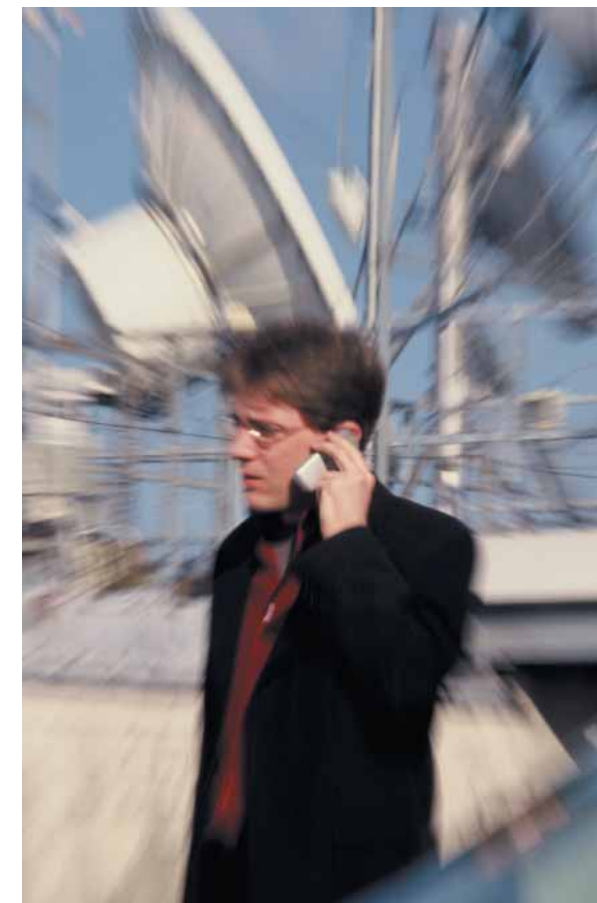
Schwindel, Unwohlsein und Nervosität wurden als Folge von Mobilfunkstrahlung beobachtet. Auch ein erhöhtes Krebsrisiko und andere schwere Erkrankungen können nicht ausgeschlossen werden.

und Japan laufenden Studien zur Überprüfung der holländischen Studie einen wirklichen Fortschritt in der Risikobewertung bringen. Wir