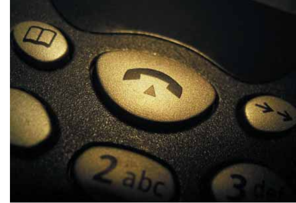
Die Taste zum Beenden des Gesprächs: schont den Geldbeutel und die Gesundheit.

Nach einer vom Bundeswirtschaftsministerium beauftragten repräsentativen Studie vom Mai 2002 halten es zwei Drittel der Bevölkerung für möglich, dass mit dem Mobilfunk Risiken für die Gesundheit verbunden sind. Etwa die Hälfte der Handy-Nutzer ist danach bereit, für mehr Vorsorge monatlich mindestens 2,50 Euro mehr Telefonkosten zu bezahlen.