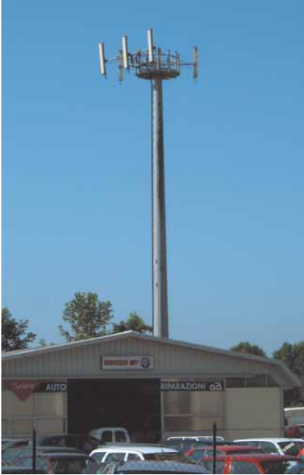
Wegen der niedrigeren Grenzwerte in Italien werden die Antennen dort oft hoch montiert.

lägen noch nicht vor, hieß es. Erst aufgrund der eindeutigen Forschungsergebnisse in den 1980er Jahren schwenkten die Behörden um. Heute kennen wir die Folgen der unbedachten Nutzung dieser Schadstoffe: Im Jahr 2005 starben nach Angaben der Berufsgenossenschaften alleine in Deutschland 1.500 Menschen an einer asbestverursachten Berufskrankheit, die gesetzliche Unfallversicherung leistet jährlich 300 Millionen Euro für Asbest-Spättschäden. Arbeiter haben die Fasern vor Jahrzehnten eingeatmet. Hinzu kommen hohe Sanierungskosten für öffentliche und private Haushalte.