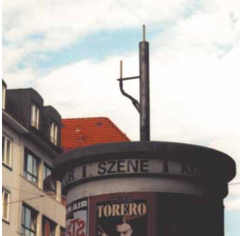
Kleine Antenne zur Versorgung des Nahbereichs (100 bis 500 Meter).

zeigen viele Handys trotz Abschirmgraden von „99 Prozent“, also einem Hundertstel der ursprünglichen Belastung noch „volles Netz“ an.